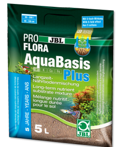
JBL PROFLORA AquaBasis plus

Engrais longue durée pour aquariums d'eau douce