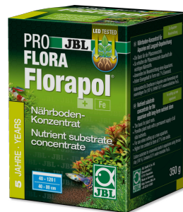
JBL PROFLORA Florapol

Fertilisant pour racines en aquarium d'eau douce