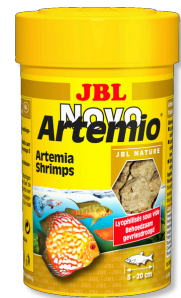
JBL NovoArtemio Complément d'artémias pour tous poissons d'aquarium