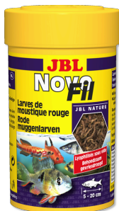
JBL NovoFil Larves de moustiques rouges pour poissons d'aquarium