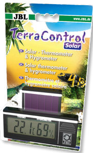
JBL TerraControl Solar Thermomètre/hygromètre solaire pour tous terrariums