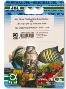
JBL Clips T5/T8 (Métal) Fixation en métal pour tubes fluorescents