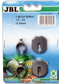
JBL SOLAR REFLECT Kit clips Fixation pour tubes fluorescents