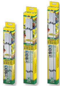
JBL SOLAR Reflect T5/ T8 (895-1500 mm) Réflecteur pour tube fluorescent SOLAR