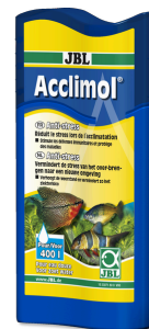
JBL Acclimol Conditionneur d'eau pour l'acclimatation des poissons