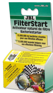
JBL FilterStart Bactéries pour activation des filtres