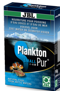
JBL Plankton Pur SMALL Friandises pour petits poissons d'aquarium