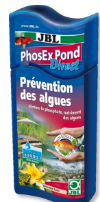
JBL PhosEX Pond Direct Éliminateur de phosphates pour bassin