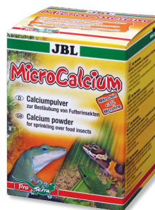
JBL MicroCalcium Complément alimentaire de minéraux pour tous reptiles