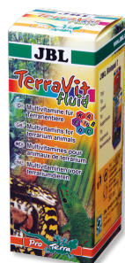
JBL TerraVit fluid Vitamines et oligoéléments pour animaux de terrarium