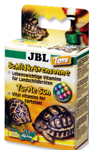
JBL Soleil Tropic Terra Vitamines pour tortues terrestres