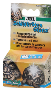
JBL Brillant pour tortues Produit d'entretien des carapaces de tortues