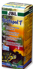
JBL Biotopol T Conditionneur d'eau pour terrarium