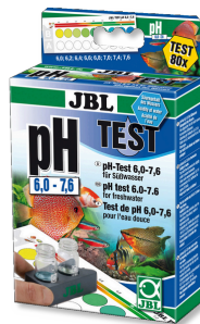
JBL Test pH 6,0-7,6 Test pH 6,0-7,6 pour aquariums eau douce