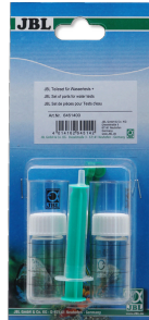
JBL Kit de pièces pour tests d'eau