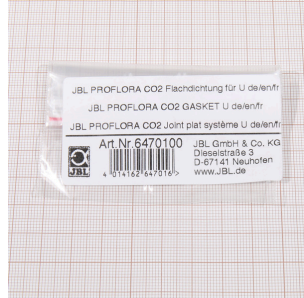
JBL PF CO2 guarnizione piatta per U