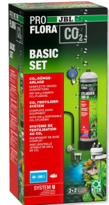
JBL PROFLORA CO2 BASIC SET U Impianto di fertilizzazione con CO2, kit di base