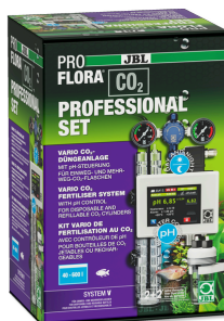
JBL PROFLORA CO2 PROFESSIONAL SET V Impianto di concimazione CO2 con comando/SENZA BOMBOLA