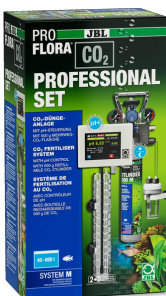
JBL PROFLORA CO2 PROFESSIONAL SET M Impianto di concimazione CO2 con comando