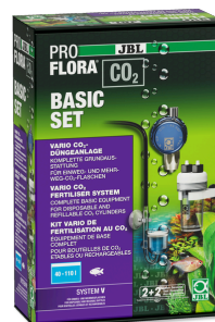
JBL PROFLORA CO2 BASIC SET V Impianto di fertilizzazione con CO2 SENZA BOMBOLA