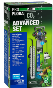
JBL PROFLORA CO2 ADVANCED SET M Kit di fertilizzazione con CO2 + spegnimento notturno