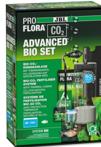
JBL PROFLORA CO2 ADVANCED BIO SET Impianto di bio CO2 per acquari d'acqua dolce 40-110 l