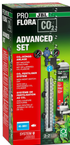
JBL PROFLORA CO2 ADVANCED SET U Kit di fertilizzazione con CO2 + spegnimento notturno