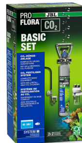
JBL PROFLORA CO2 BASIC SET M Impianto di fertilizzazione con CO2, kit di base