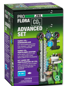
JBL PROFLORA CO2 ADVANCED SET V Impianto di CO2 SENZA BOMBOLA con manometri e valvola