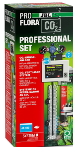
JBL PROFLORA CO2 PROFESSIONAL SET U Impianto di concimazione completo con comando CO2/ pH