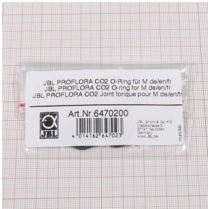
JBL PROFLORA CO2 o- ring per M