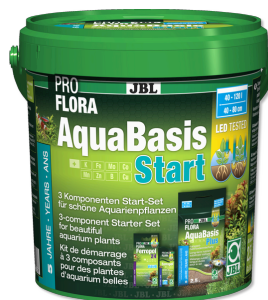
JBL PROFLORA ProFloraStart Kit fertilizzante piante per acquari d'acqua dolce