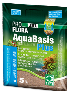
JBL PROFLORA AquaBasis plus Substrato nutriente a lunga durata per acquari