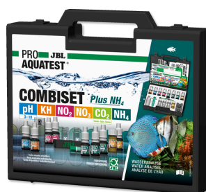
JBL PROAQUATEST COMBISET Plus NH4 Valigetta con i più importanti test acqua + test NH4