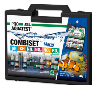
JBL PROAQUATEST COMBISET Marin Valigetta test per le analisi negli acquari marini