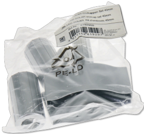
JBL LED SOLAR set cappucci terminali