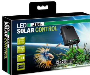
JBL LED SOLAR CONTROL

Dispositivo di controllo per le lampade JBL LED SOLAR