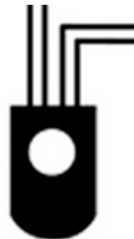
JBL LED SOLAR IR sensore universale