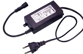
JBL LED SOLAR driver