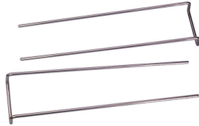
JBL LED SOLAR kit staffa di supporto