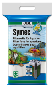
JBL Symec ovatta filtrante Ovatta filtrante contro tutti gli intorbidamenti