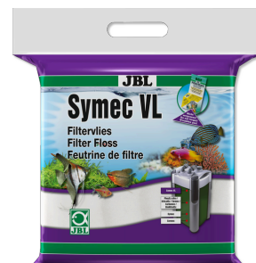
JBL Symec VL Vello d'ovatta contro tutti gli intorbidamenti