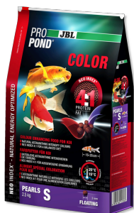
JBL PROPOND COLOR S Mangime colori per piccole koi