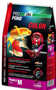
JBL PROPOND COLOR M Mangime colori per koi medie