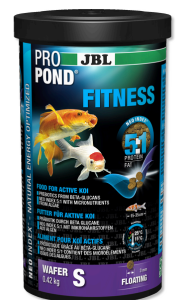
JBL PROPOND FITNESS S Mangime per koi attive