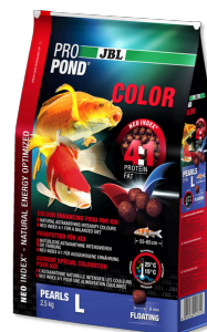
JBL PROPOND COLOR L Mangime colori per grandi koi