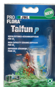
JBL PROFLORA Taifun P Mini diffusore CO2 per nano acquari d'acqua dolce