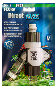
JBL PROFLORA Direct Diffusore diretto ad alto rendimento per la CO2