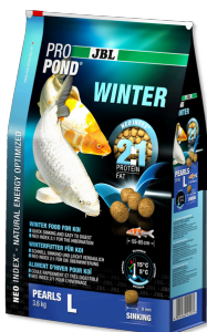
JBL PROPOND WINTER L