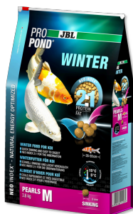
JBL PROPOND WINTER M