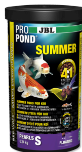
JBL PROPOND SUMMER S