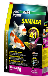
JBL PROPOND SUMMER M