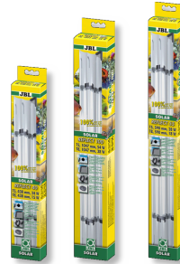
JBL SOLAR Reflect T5/T8 - 895-1500 mm Pannello riflettore per tubo fluorescente Solar