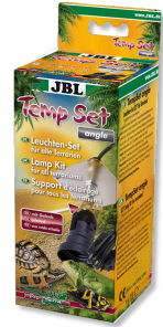
JBL TempSet angle Kit di installazione per faretto da terrari