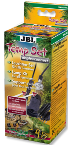
JBL TempSet angle+ connect Kit di installazione per faretto da terrari