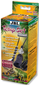
JBL TempSet connect Kit di installazione con connettore