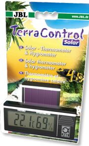
JBL TerraControl Solar Termometro e igrometro solari per tutti i terrari