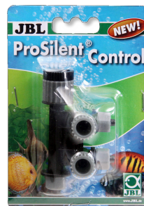
JBL ProSilent Control Rubinetto di chiusura aria regolabile