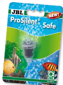
JBL ProSilent Safe Valvola di non ritorno