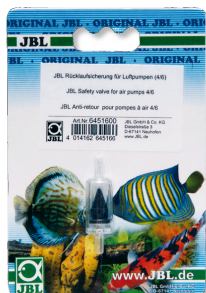
JBL Valvola di non ritorno Valvola di non ritorno per pompe ad aria