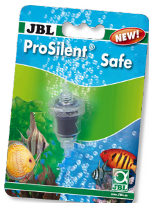
JBL ProSilent Safe Valvola di non ritorno