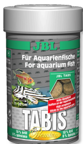
JBL Tabis Mangime Premium in compresse per tutti i pesci