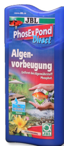
JBL PhosEx Pond Direct

Test rapido per determinare i valori di pH e KH