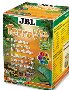
JBL TerraVit Vitamine ed elementi traccia per animali da terrario