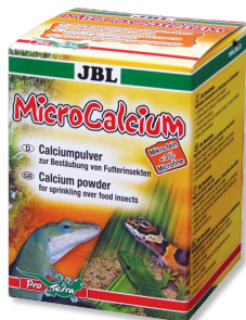
JBL MicroCalcium Mangime complementare con minerali per tutti i rettili