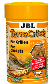
JBL TerraCrick Mangime completo per insetti da pasto