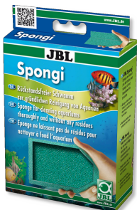
JBL Spongi Spugna per la pulizia di acquari e terrari