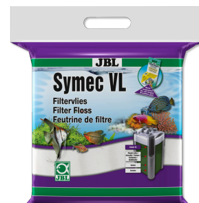
JBL Symec VL Vello d'ovatta contro tutti gli intorbidamenti