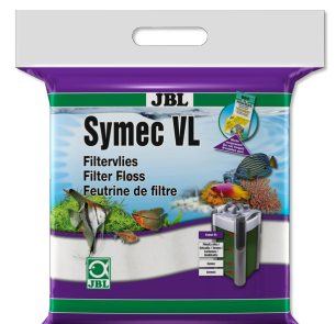
JBL Symec VL Vello d'ovatta contro tutti gli intorbidamenti