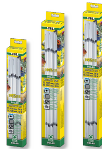
JBL SOLAR Reflect T5/ T8 - 895-1500 mm Pannello riflettore per tubo fluorescente Solar