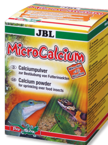
JBL MicroCalcium Mangime complementare con minerali per tutti i rettili