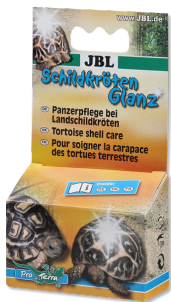
JBL Splendore per tartarughe Cura per il carapace delle tartarughe terrestri