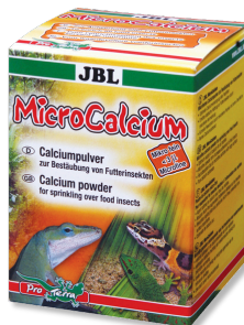
JBL MicroCalcium Mangime complementare con minerali per tutti i rettili