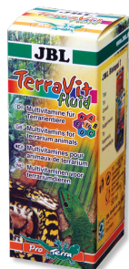
JBL TerraVit fluid Vitamine ed elementi traccia per animali da terrario