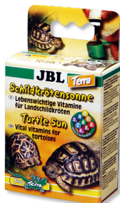
JBL Sole per tartarughe Terra Vitamine per tartarughe di terra