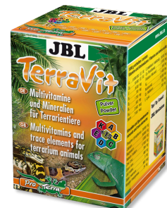
JBL TerraVit Vitamine ed elementi traccia per animali da terrario