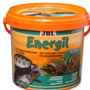
JBL Energil Mangime di base per tartarughe palustri e acquatiche