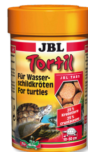
JBL Tortil Mangime in compresse per tartarughe d'acqua e palustri