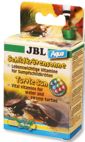
JBL Sole per tartarughe Aqua Vitamine per tartarughe terrestri e palustri