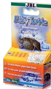
JBL Easy Turtle Granulato speciale per eliminare gli odori