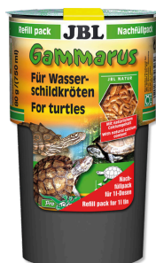
JBL Gammarus, ricarica Leccornia per tartarughe acquatiche da 10 a 50 cm