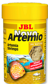
JBL NovoArtemio Mangime complementare per tutti i pesci d'acquario