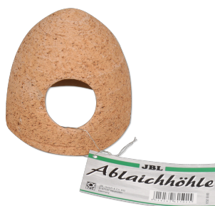
JBL Grotta in ceramica Caverna in ceramica per acquari di acqua dolce