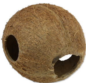
JBL Cocos Cava Grotta di noce di cocco per acquari e terrari