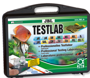
JBL Testlab Valigetta con 13 test per analisi acqua dolce. Testlab