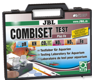
JBL Test Combi kit Plus Fe Valigetta con i più importanti test acqua + test ferro