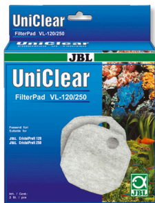
JBL FilterPad VL Vello di ovatta per filtri d'acquario CristalProfi