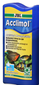
JBL Acclimol Preparazione dell'acqua per un nuovo ambientamento