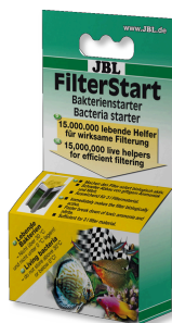
JBL FilterStart Batteri per l'attivazione del filtro