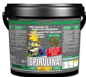
JBL Spirulina Mangime di base premium per gli alghivori in acquario