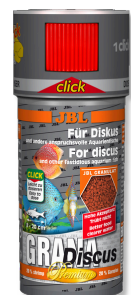
JBL GranaDiscus CLICK Mangime completo Premium in granuli per pesci disco