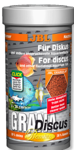
JBL GranaDiscus Mangime di base Premium in granuli per pesci disco