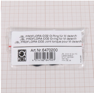
JBL PROFLORA CO2 уплотн. кольцо для M