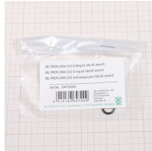
JBL PF CO2 уплотн. кольцо для VALVE