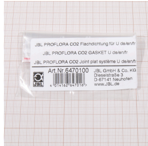
JBL PF CO2 плоское уплотнение для U