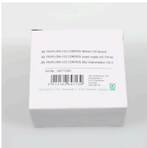
JBL PF CO2 CONTROL блок питания 12 В