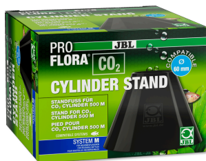
JBL PROFLORA CO2 CYLINDER STAND Подставка для баллонов CO2 500 г