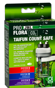
JBL PROFLORA CO2 TAIFUN COUNT SAFE Счетчик пузырьков CO2 со встроенным обратным клапаном