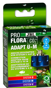
JBL PROFLORA CO2 ADAPT U - M Адаптер CO2 д/переоснащ. с одно- на многораз. баллоны