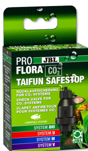
JBL PROFLORA CO2 TAIFUN SAFESTOP Защита от обратного тока воды для установок CO2