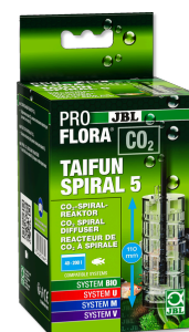
JBL PROFLORA CO2 TAIFUN SPIRAL 5 Нарастиваемый реактор CO2 для пресн. аквариумов 200 л