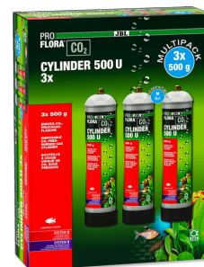
JBL PROFLORA CO2 CYLINDER 500 U 3x Запасной одноразовый баллон 500 г CO2 (упаковка 3 шт.)