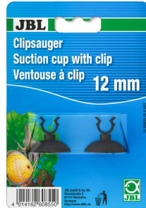
JBL suction cup with clip, 12 мм Резиновая присоска с зажимом для предметов диаметром 12 мм