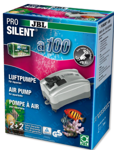
JBL PROSILENT a100 Компрессор для пресноводных и морских аквариумов