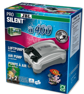
JBL PROSILENT a400 Компрессор для пресноводных и морских аквариумов