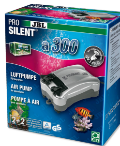
JBL PROSILENT a300 Компрессор для пресноводных и морских аквариумов