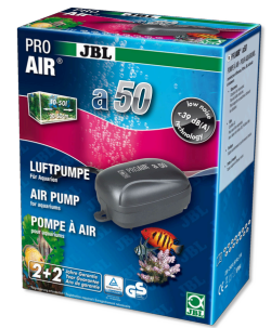
JBL PROAIR a50 Компрессор для аквариума