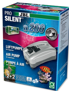
JBL PROSILENT a200 Компрессор для пресноводных и морских аквариумов