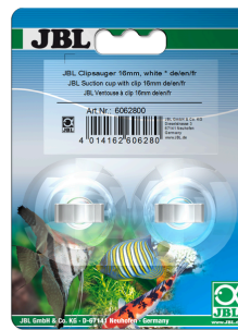
JBL suction cup with clip, 16 мм Резиновые присоски для объектов диаметром 16 мм