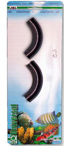
JBL AntiKink Защита от перегиба шланга