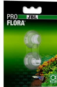
JBL suction cup with clip, 6 мм Прозрачные присоски с клипсой для объектов с диаметром \approx 6 мм