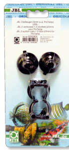
JBL suction cup with clip 23 мм Резиновые присоски для предметов диаметром 23-28 мм