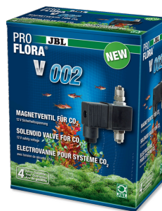
JBL PROFLORA v002 Бесшумный электромагнитный клапан