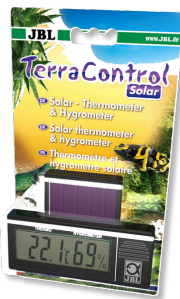
JBL TerraControl Solar Термометр и гигрометр для любых террариумов