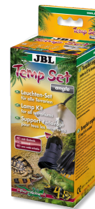
JBL TempSet angle Комплект для установки ламп в террариуме