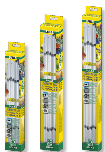
JBL SOLAR Reflect T5/ T8 - 895-1500 мм Отражатель для люминесцентных ламп Solar