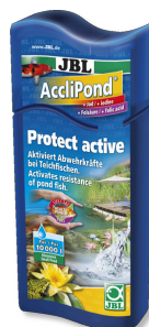
JBL AccliPond Кондиционер для прудовой воды