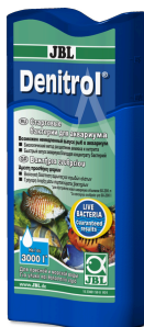
JBL Denitrol Стартовые бактерии для подселения аквариумных рыб