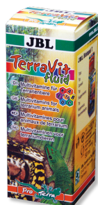
JBL TerraVit fluid Витамины и микроэлементы для террариумных животных