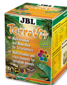
JBL TerraVit Витамины и микроэлементы для террариумных животных