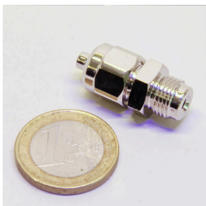
JBL резьбовое соединение шланга 4/6, редуктор